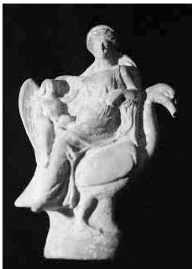
Figure 4. Aphrodite et Éros chevauchant un cygne (ou une oie). Statuette de terre cuite, Tarentum (Tarente), env. 380 av. J.-C. British Museum 1308.

copie romaine de l'« Aphrodite accroupie », un fragment représente une oie étendue sous la silhouette de la déesse (28). De telles scènes soulignent les accessoires vipérin mais aussi aviaire associés à cette déesse. Est ainsi avérée une complémentarité thématique entre le serpent et l'oiseau.