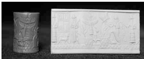
Figure 2. Sceau cylindrique, British Museum, BM n° 89115, 91-5-9.2553, montrant Inanna ailée ; env. 2300 av. J.-C.

attache des têtes à son dos ; elle attache des mains à sa ceinture ; elle patauge jusqu'aux genoux dans le sang [...] Anat exulte. Son foie est plein de rire, son cœur est plein de joie. » (23)