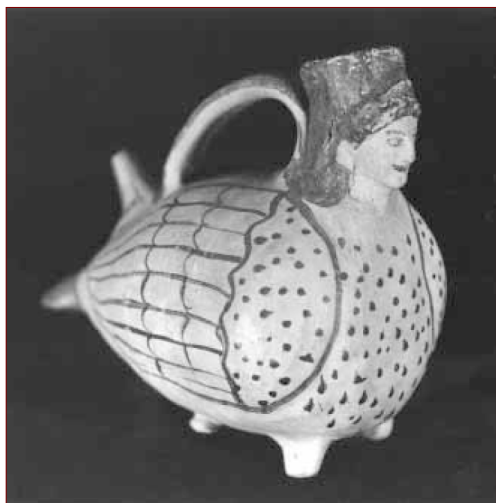
Figure 10. Bouteille de parfum en terre cuite, en forme de Sirène. British Museum n° 1846.5-12.14 ; fabriquée en Sicile vers 500 av. J.-C. (Avec l'aimable autorisation du British Museum.)

« Celui qui, poussé par son imprudence, écoutera la voix des Sirènes, ne verra plus son épouse ni ses enfants chéris qui seraient cependant charmés de son retour ; les Sirènes couchées dans une prairie captiveront ce guerrier de leurs voix harmonieuses. Autour d'elles sont les ossements et les chairs desséchées des victimes qu'elles ont fait périr. » (40)