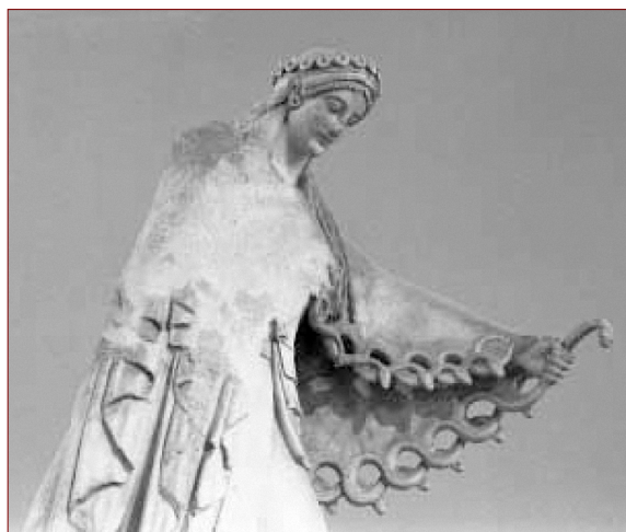
Figure 6. Athéna (fronton du temple des Pisistratides, groupe de la Gigantomachie), musée de l'Acropole, Athènes, Grèce, n° 631, environ 520 av. J.-C.

gardien de l'Acropole. Le buste d'Athéna est recouvert d'une égide, c'est-à-dire une cuirasse ou un bouclier à la bordure décorée de serpents lovés et au milieu de laquelle se trouve la tête de Méduse, la Gorgone ailée à chevelure serpentine (32).