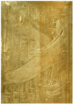
Illustration de page de titre : La déesse Isis ailée, découverte dans le tombeau du pharaon Toutânkhamon.