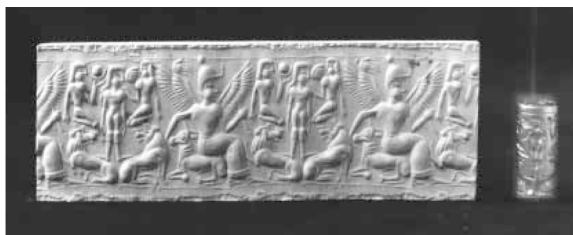
Figure 3. Sceau cylindrique, musée du Louvre, n° AO17.242, représentant Anat ailée ; Ras Shamra, Syrie, env. 1300 av. J.-C.

La déesse égyptienne Isis était, elle aussi, représentée avec des ailes qu'elle maintenait étendues afin de protéger sa charge 3 , qui était l'âme du défunt (24). Dans le Livre des Morts (1550 à 1080 av. J.-C.), elle déclare au trépassé :