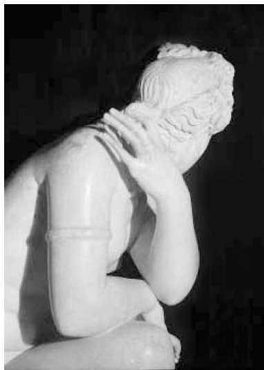
Figure 5. « Aphrodite accroupie ». Copie romaine de marbre ; 1 er siècle après J.-C. British Museum 1963.10-29.1. (Avec l'aimable autorisation du British Museum.)

Ce constat s'applique également à la déesse grecque Athéna. Les attributs aviaires d'Athéna sont souvent visibles dans l' Illiade et l' Odyssée d'Homère :